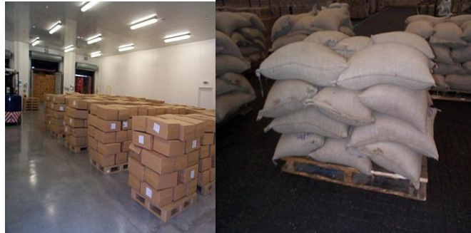
شکل ۱- نمونه‌ای از چیدمان مناسب در انبارها به منظور نمونه برداری

یادآوری - به منظور سهولت در امر نمونه برداری، تعداد بسته‌ها و طرز چیدن آن‌ها باید متناسب با گنجایش انبار و بر اساس استاندارد ملی ایران به شماره ۵۵، روش‌های انبارداری، باشد، به طوری که نمونه بردار بتواند به آسانی به کلیه بسته‌ها دسترسی داشته باشد.