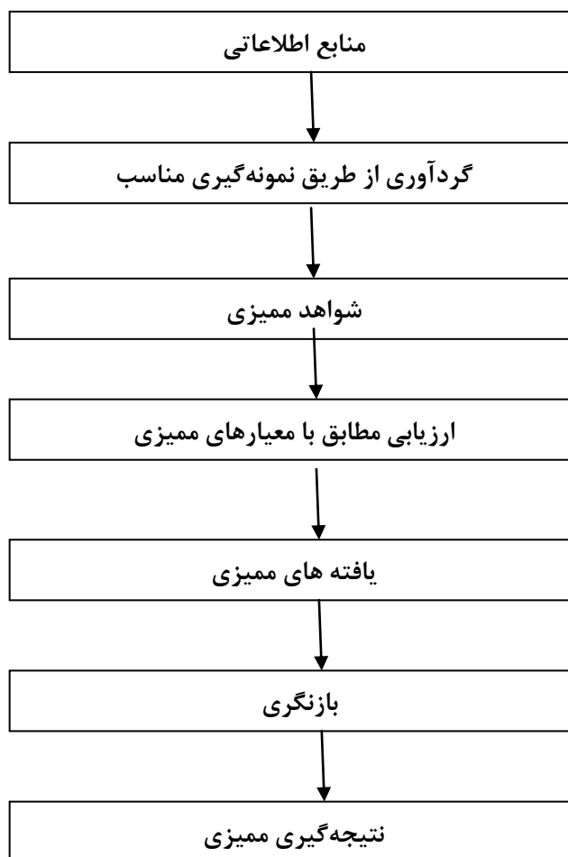
شکل ۳- دید کلی از فرآیند گردآوری و تصدیق اطلاعات

شکل ۳ دید کلی فرآیند ممیزی را از گردآوری اطلاعات تا دستیابی به نتیجه‌گیری‌های ممیزی ارائه می‌نماید.